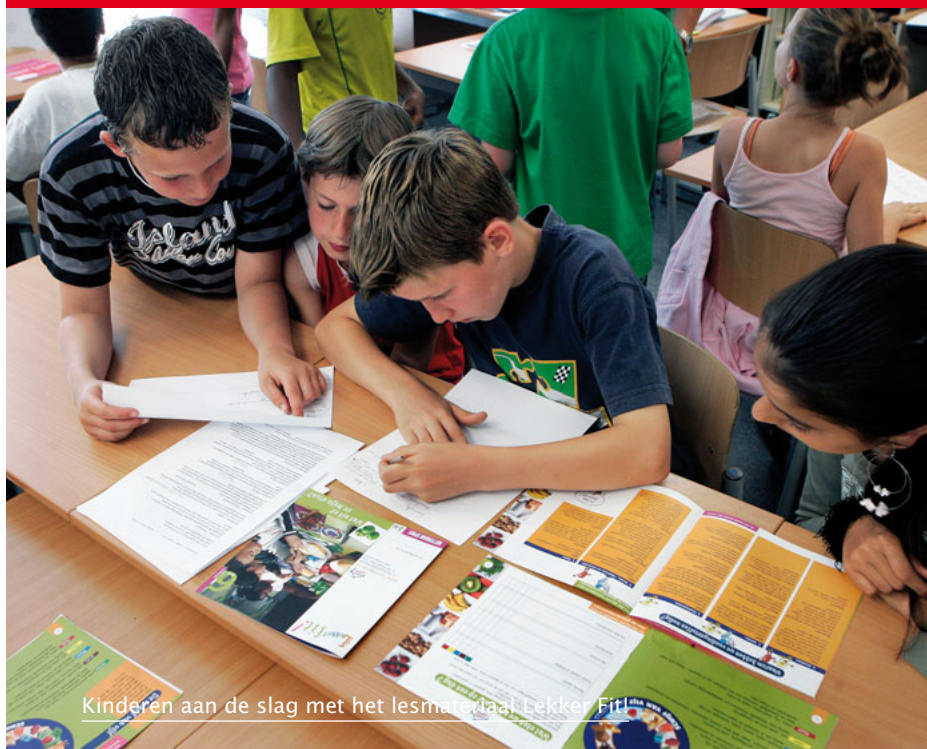
Kinderen aan de slag met het lesmateriaal 'Lekker Fit!'